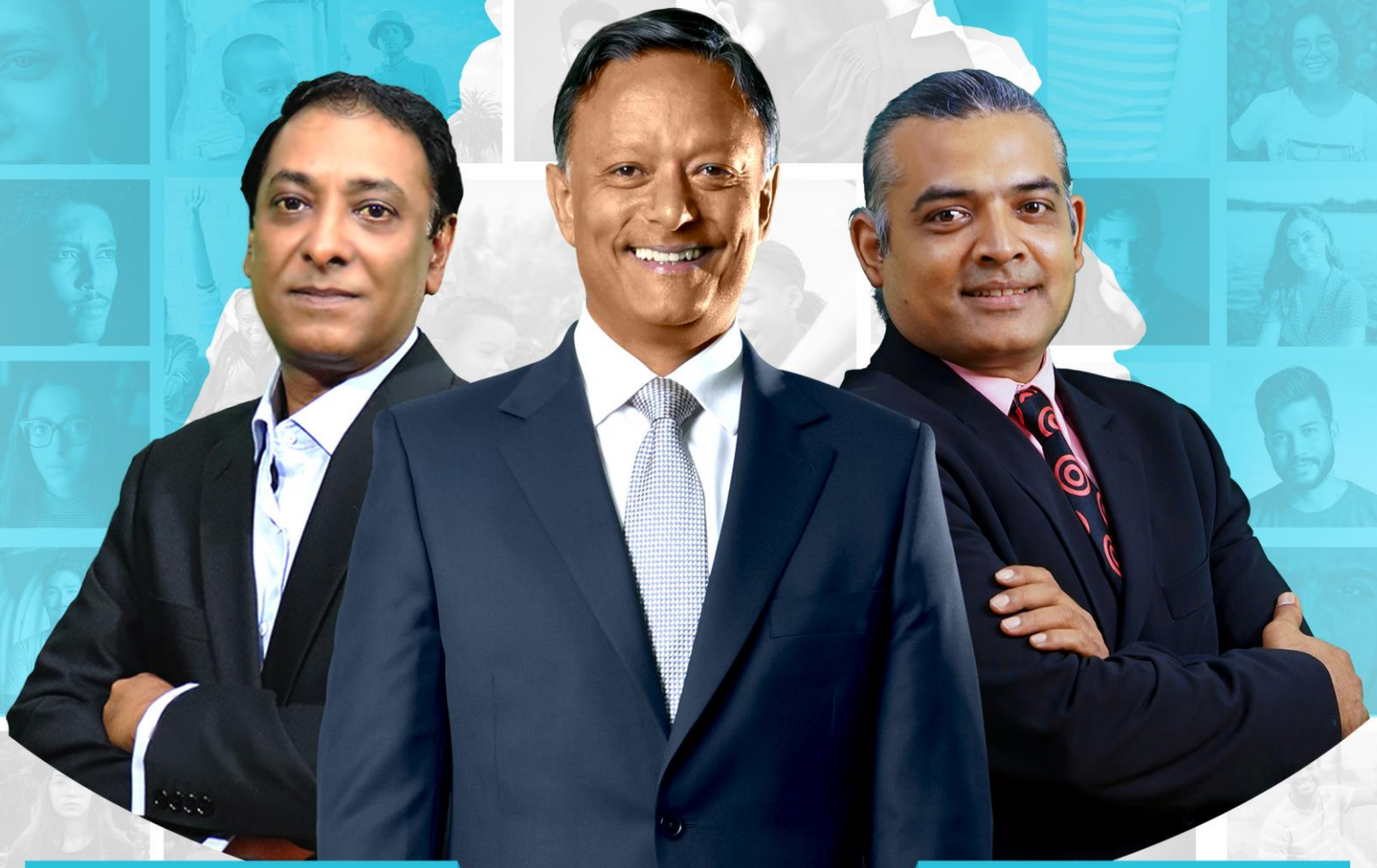
DEV SUNNASY VICE PM

Economic Development & Government Transformation